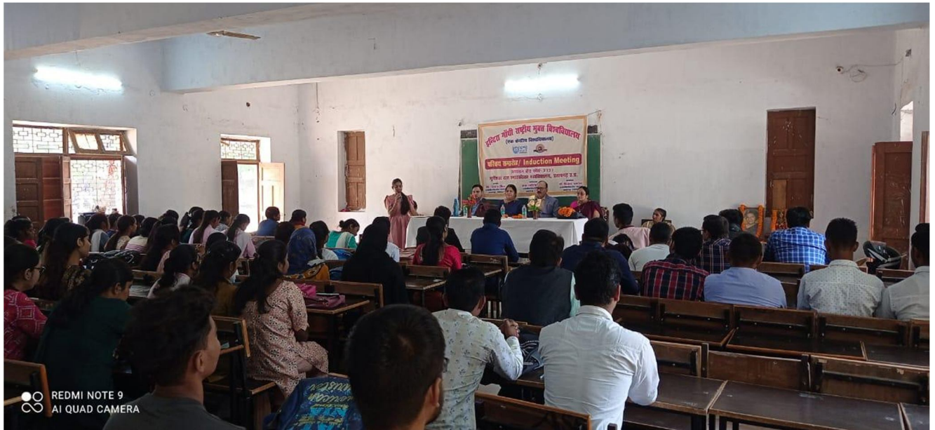
Induction meeting at IGNOU LSC(R) 2703, Allahabad Degree College, Allahabad on 20.11.2022