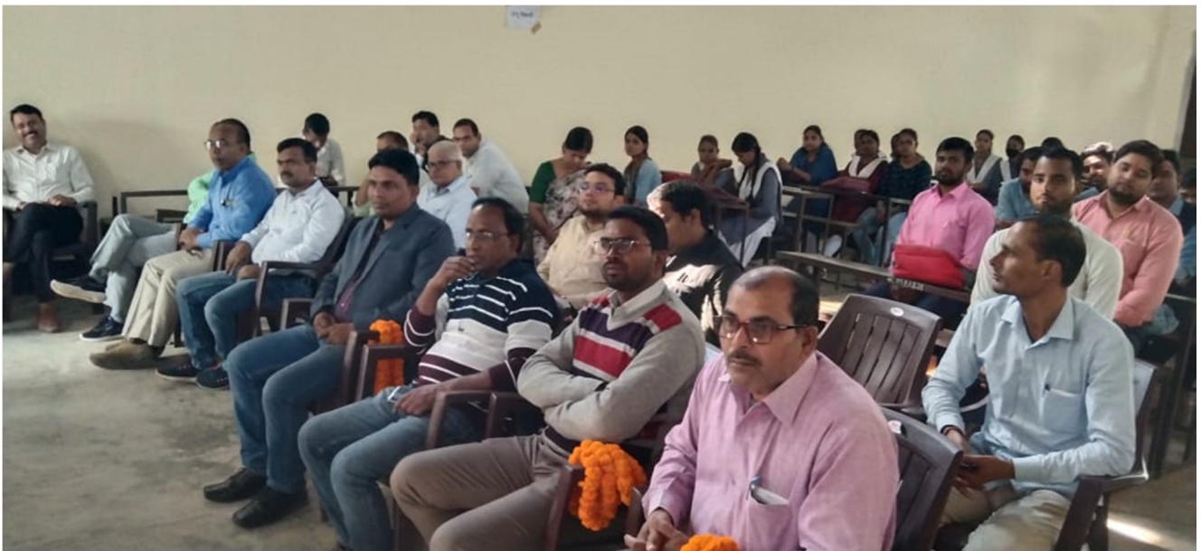
Induction meeting at IGNOU LSC(R) 48011, D C S Khandelwal PG Collge, Mau on 15.11.2022